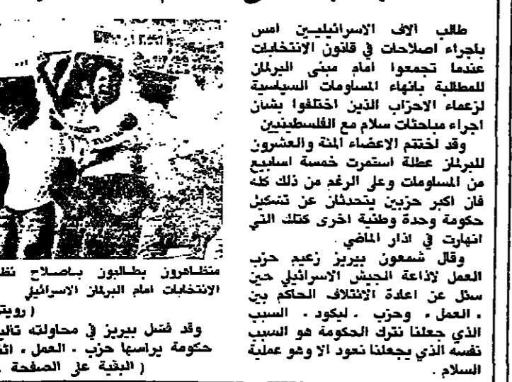
متظاهرون يطالبون باصلاح نظام الانتخابات امام البرلمان الاسرائيلي

احتمال ائتلاف «العمل» و «الليكود» الاف الاسرائيليين يتظاهرون للمطالبة باصلاح نظام الانتخابات